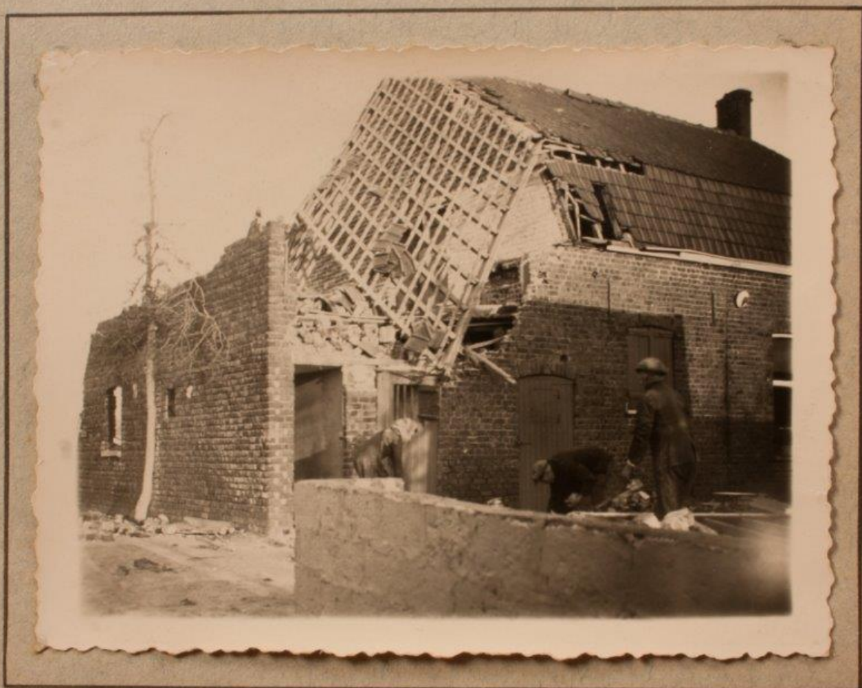
Na den Storm van november 1940.